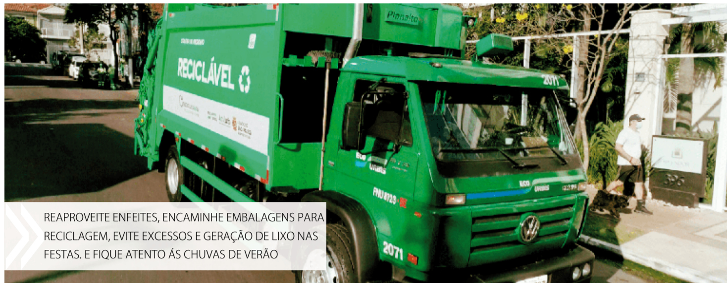
REAPROVEITE ENFEITES, ENCAMINHE EMBALAGENS PARA RECICLAGEM, EVITE EXCESSOS E GERAÇÃO DE LIXO NAS FESTAS. E FIQUE ATENTO ÀS CHUVAS DE VERÃO

Em São Paulo, o cidadão conta com o conforto de ver o caminhão da coleta seletiva passando em sua porta. Embora ainda não universalizado, ou seja, disponível em todas as vias da cidade, o serviço já